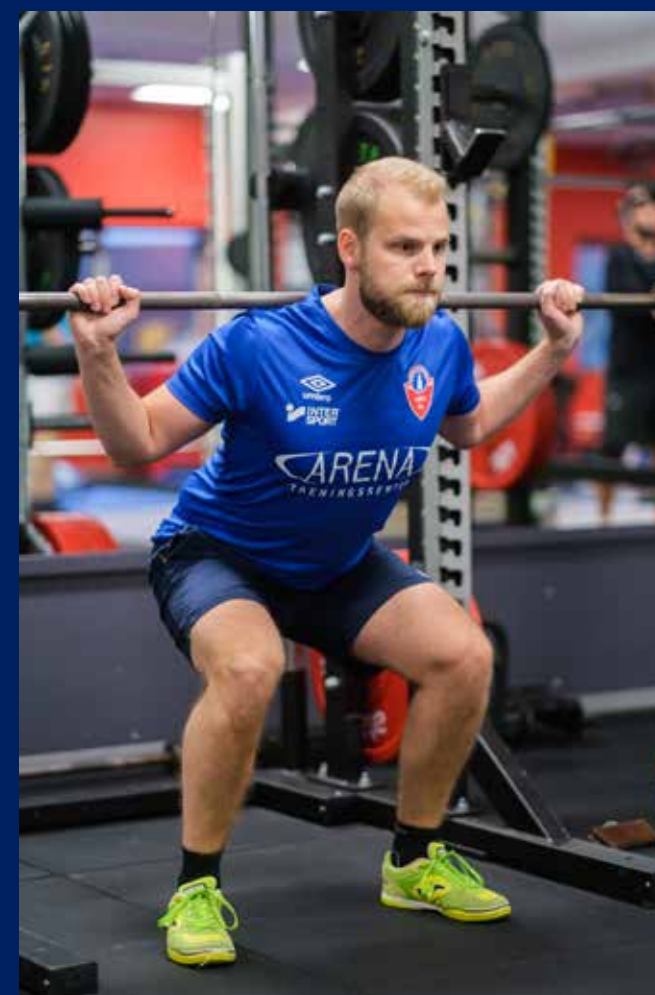
A-laget trener på Arena Treningssenter!